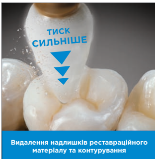
Видалення надлишків реставраційного матеріалу та контурування