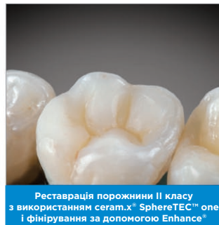
Реставрація порожнини II класу з використанням ceram.x® SphereTEC™ one і фінірування за допомогою Enhance®