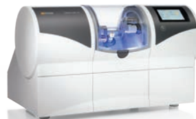
CEREC MC / MC X/ Premium Package Від 31900 EUR