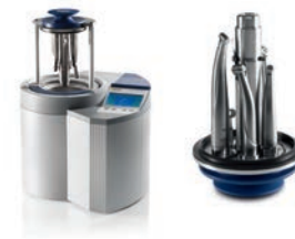
DAC Universal комбінований автоклав