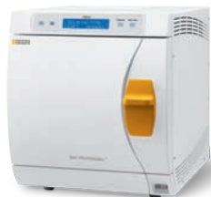
DAC Professional DAC Professional+