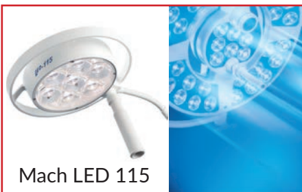
Mach LED 115