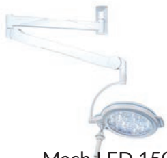
Mach LED 150