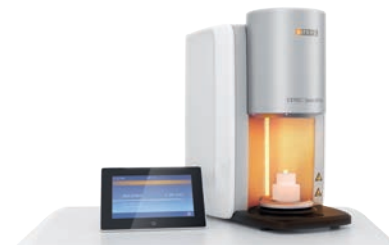
CEREC SpeedFire 9990 EUR