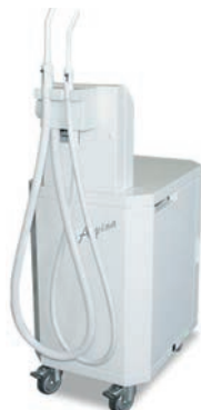
DO M (ASPINA)