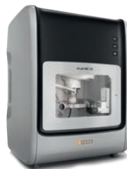
inLab MC X5 40000 EUR