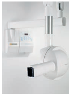
Vario DG 1926 EUR