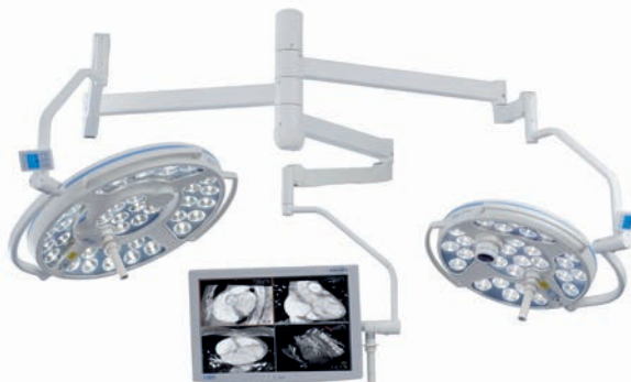
Mach LED 3 SC/MC