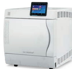
DAC Premium DAC Prmeium+