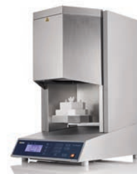
inFire HTC 11500 EUR