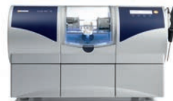
inLab MC XL 40000 EUR