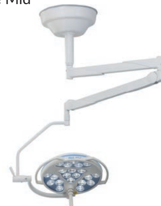
Mach LED 2 SC Hybrid