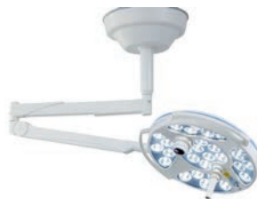
Mach LED 5 SC/MC