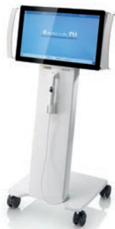
Apollo DI 16000 EUR