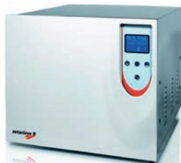
Zetaclave B18 Zetaclave B 23