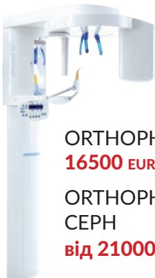
ORTHOPHOS XG 3