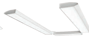
Primo / Primo U