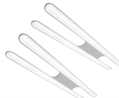
Brite / Brite Duo / Brite Mid