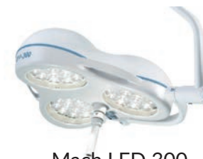
Mach LED 300