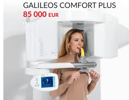
GALILEOS COMFORT PLUS