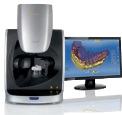
inEos X5 20000 EUR